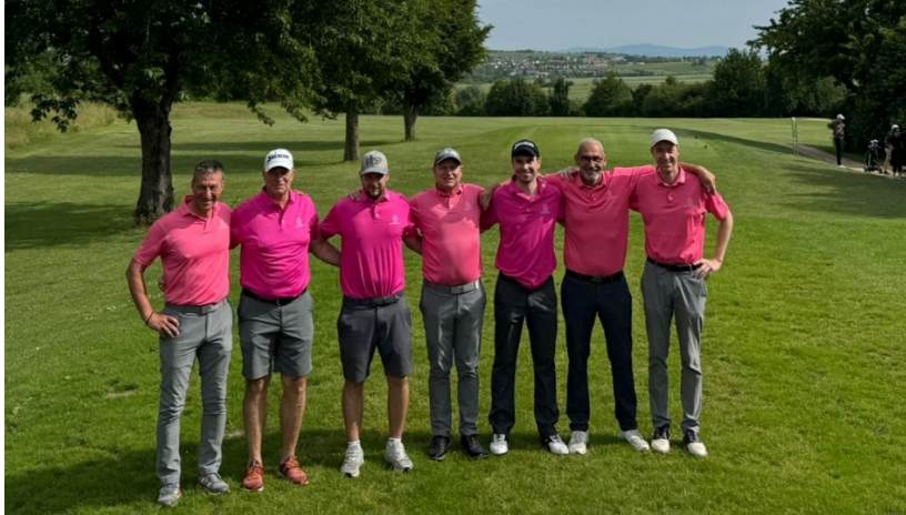
Vor dem Spiel ....